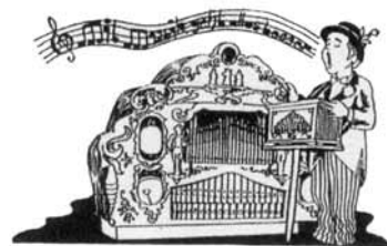
Stichting Friese Draaiorgelvrienden