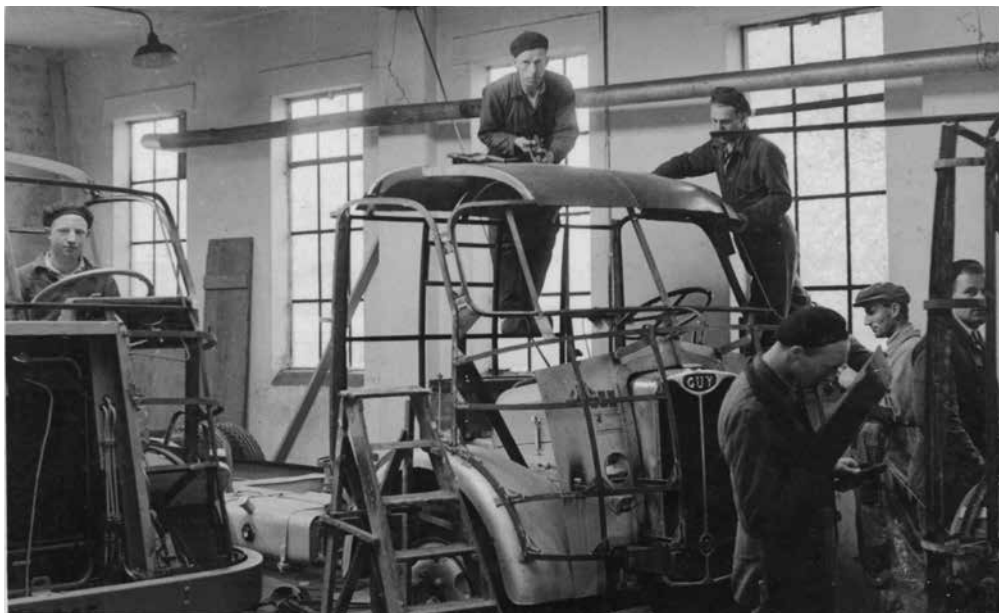
Bijscript foto: Collectie familie Brouwers, gebruikt op de omslag van het boek.

Voor autoliefhebber is het boek een prachtig naslagwerk. Exemplaren van het boek zijn na 24 september te koop in Museum Dokkum en boekhandel Van der Velde in Dokkum.